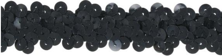
SM2R/BLK noir / black