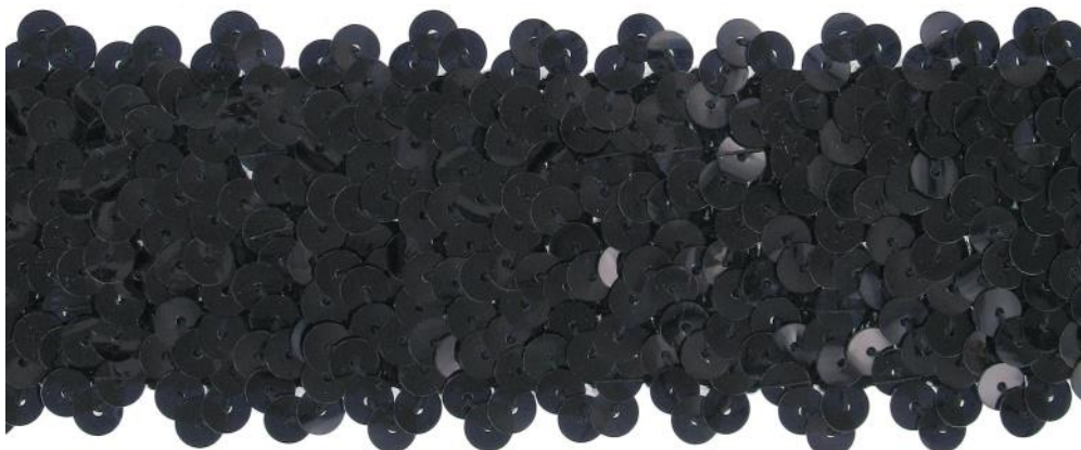
SM5R/BLK noir / black