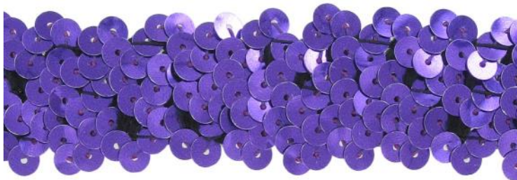
SM3R/PUR violet / purple