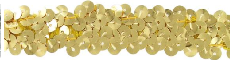
SM2R/GL or / gold