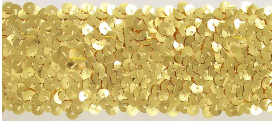
SM5R/GL or / gold