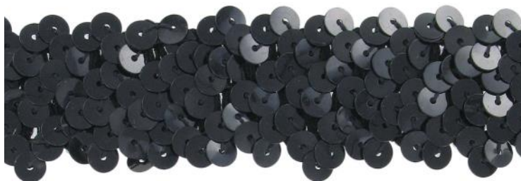
SM3R/BLK noir / black