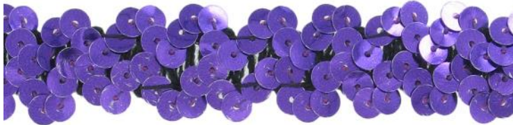
SM2R/PUR violet / purple