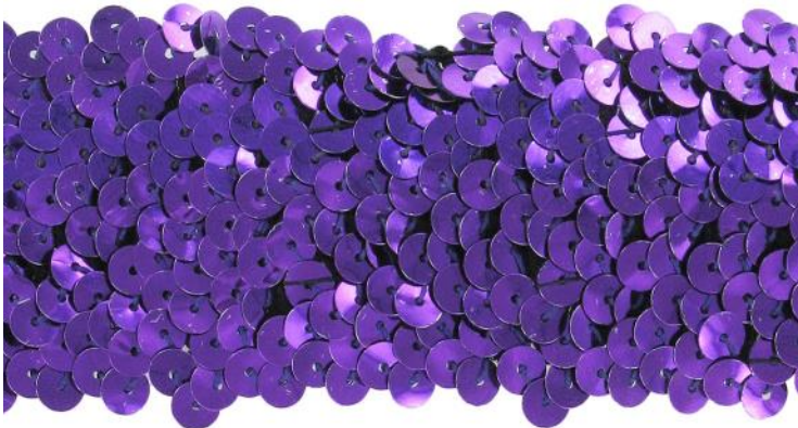
SM5R/PUR violet / purple