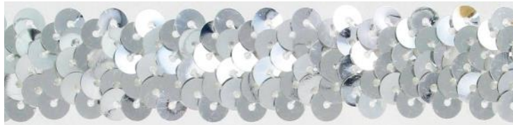
SM2R/SI argent / silver