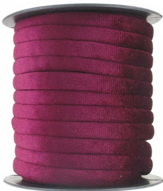
taille réduite reduced in size