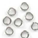
JR5MM10/SS 5mm 1mm, (18ga)