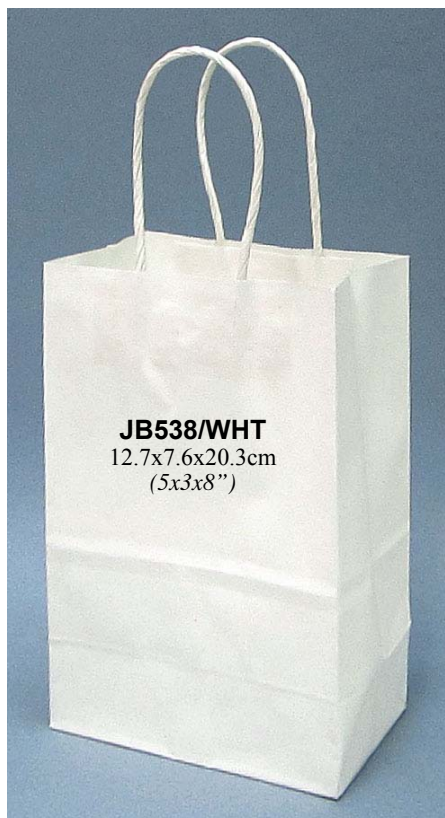
JB538/WHT 12.7x7.6x20.3cm (5x3x8")