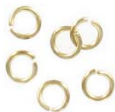
JR6MM10/RAW 6mm 1mm, (18ga) base de laiton brass core