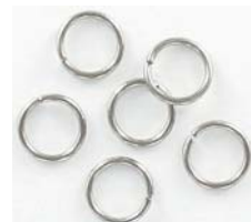
JR8MM10/SS 8mm 1mm, (18ga)