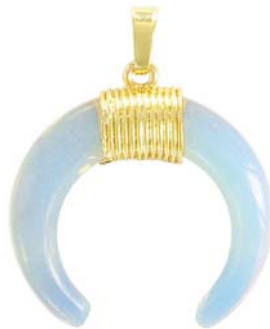
SPP1691G/MOON ~35mm pierre de lune, synthétique synthetic moonstone