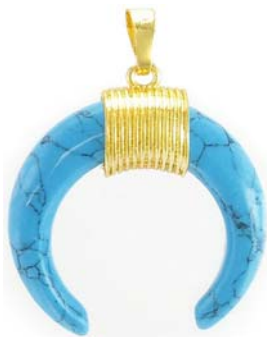
SPP1691G/WHHOW ~35mm howlite bleu/ blue howlite