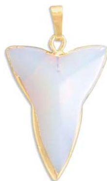
SPP1690/MOON 35x25mm pierre de lune, synthétique synthetic moonstone