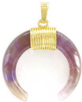
SPP1691G/AMET ~35mm améthyste/ amethyst