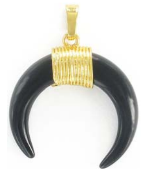
SPP1691G/BLKON ~35mm onyx noir/ black onyx