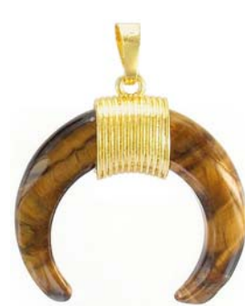
SPP1691G/GTE ~35mm œil de tigre/ tiger's eye