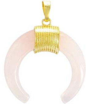
SPP1691G/RQ ~35mm quartz rose/ rose quartz