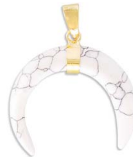
SPP1689/WHHOW ~30mm howlite blanc/ white howlite

Appelez-nous pour vous informer des autres formes disponible en semi-précieuses.