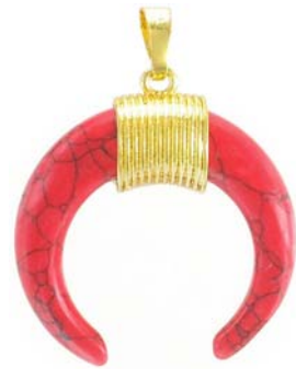
SPP1691G/WHHOW ~35mm howlite rouge/ red howlite