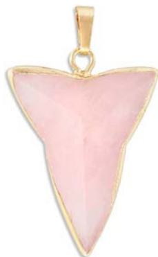
SPP1690/RQ 35x25mm quartz rose, synthétique synthetic rose quartz