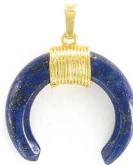
SPP1691G/LAP ~35mm lapis lazuli